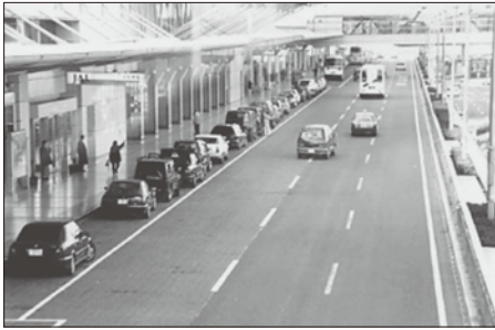
airport terminal / so